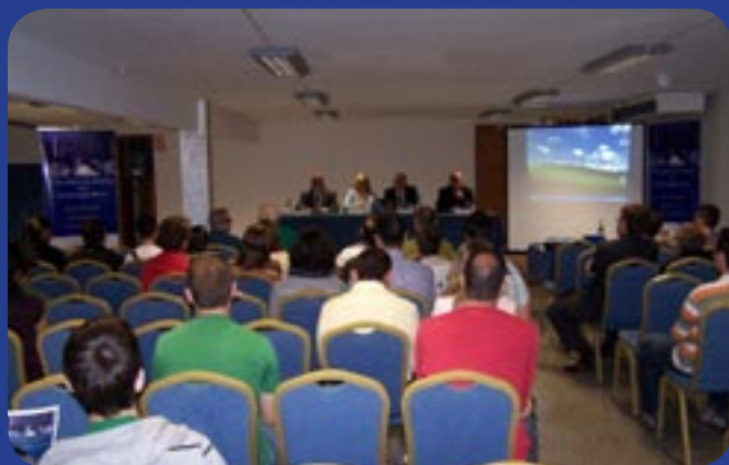
Asistentes al acto de Inauguración