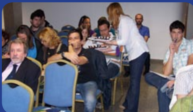
Degustación de recetas de cocina del libro "La Alimentación en la enfermedad renal: recetario práctico de cocina para el enfermo renal y su familia"