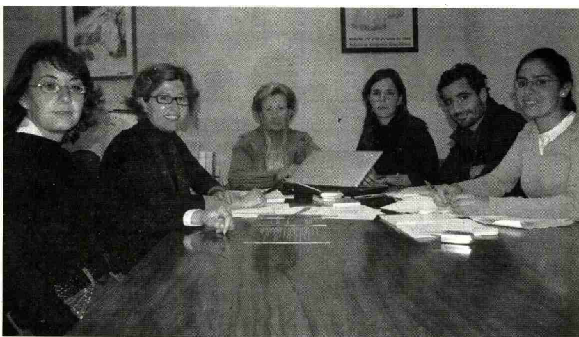
Grupo de trabajadores y colaboradores de Alcer-Onuba