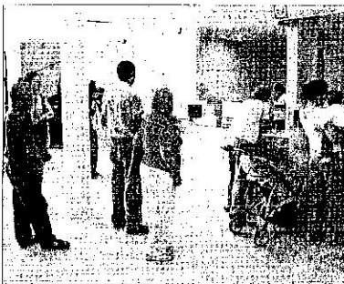
Usuarios del centro de salud Plaza de Toros, en Almería.

Los profesionales llevan a cabo también el tratamiento de pequeños lipomas y la extracción de cuerpos extraños alojados en la piel y el tejido subcutáneo, así como la realización de infiltraciones y la extracción local de fibromas, lunares y